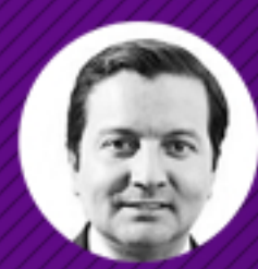
David Luna MINISTRO TIC