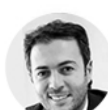
Daniel Quintero Calle VICEMINISTRO DE ECONOMÍA DIGITAL CIO del Estado colombiano